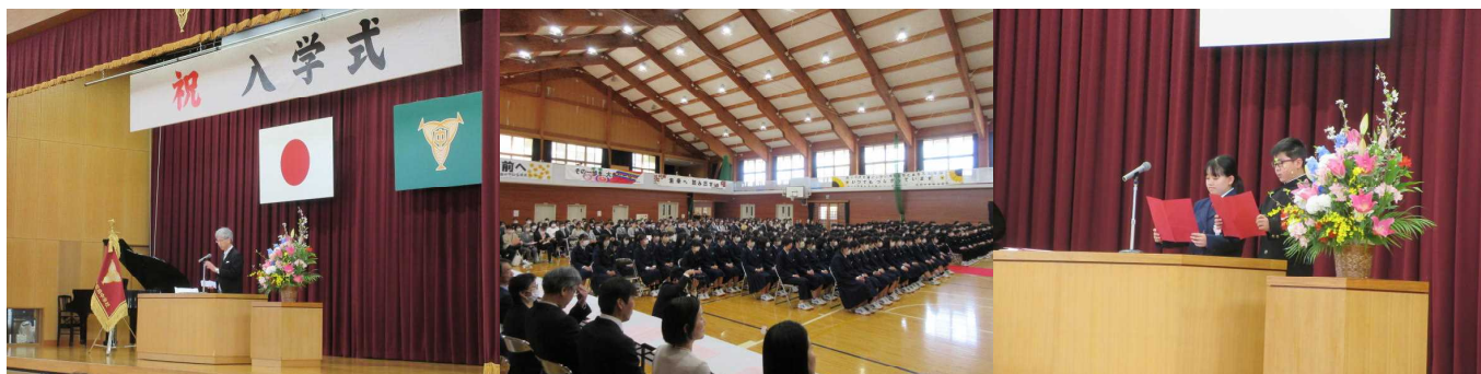
【入学式】 128名の新しい仲間を迎えました

1学期も今日で終わりです。あっという間に過ぎたこの1学期を振り返ってみましょう。