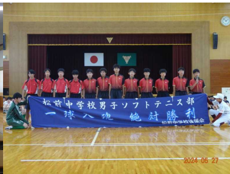
【伊予地区総体壮行会】